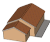
Élément virtuel incrusté